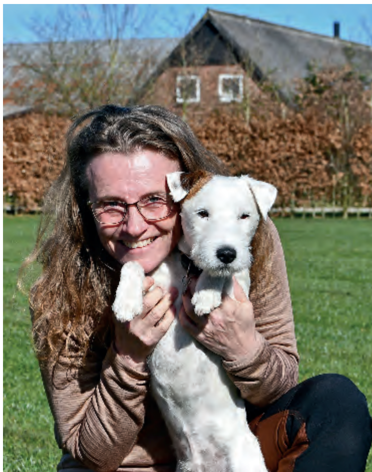
Selfie med hund i haven i Skovlund.

De bedste hilsner til jer alle. VI SES 😊