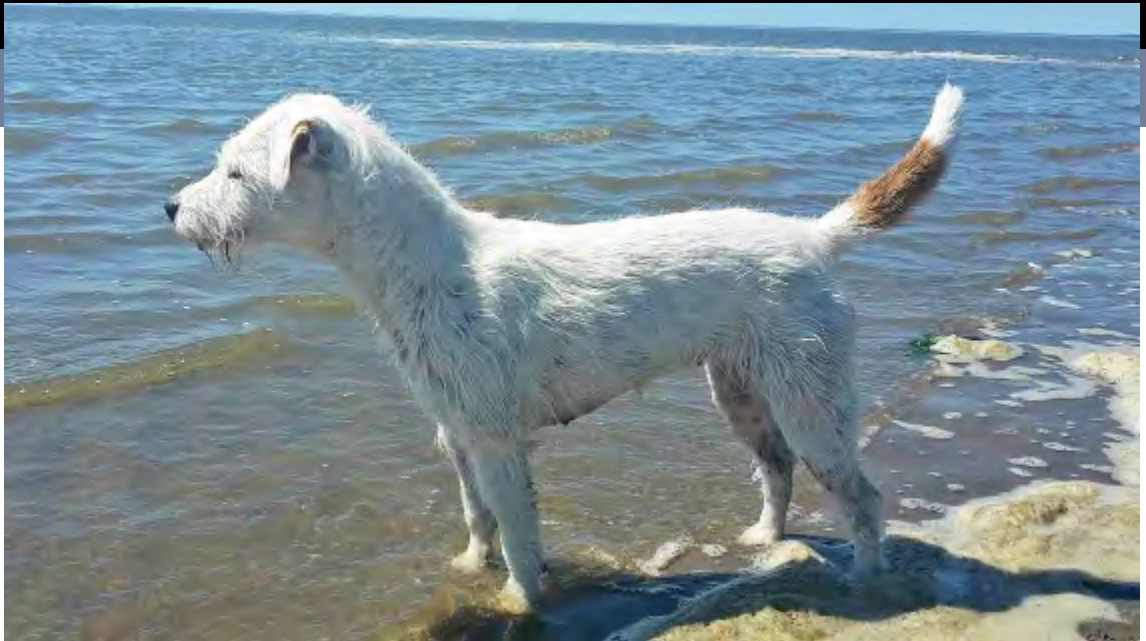
Ranja elsker også Vadehavet om sommeren

I sæson 2018 blev der i Ballum og omegn skudt over 35 ræve, de 15 fik Ranja af grav, en del blev skudt på anstand med riffel, og enkelte blev skudt på fællesjagter. I vintermånederne bruger vi ofte en del tid på rævejagt, vi er ikke altid heldige at træffe ræven hjemme, så er det bare bedre held næste gang. Favoritterne er dog halmstakke af rundballer, et rent eldorado for forelskede ræve i januar-februar måned. Husk reguleringstilladelse i februar.